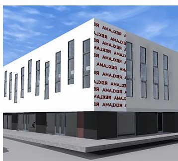
115, Gorzów Wielkopolski, dz. nr 1841 IANDLOWO-USLUGOWE